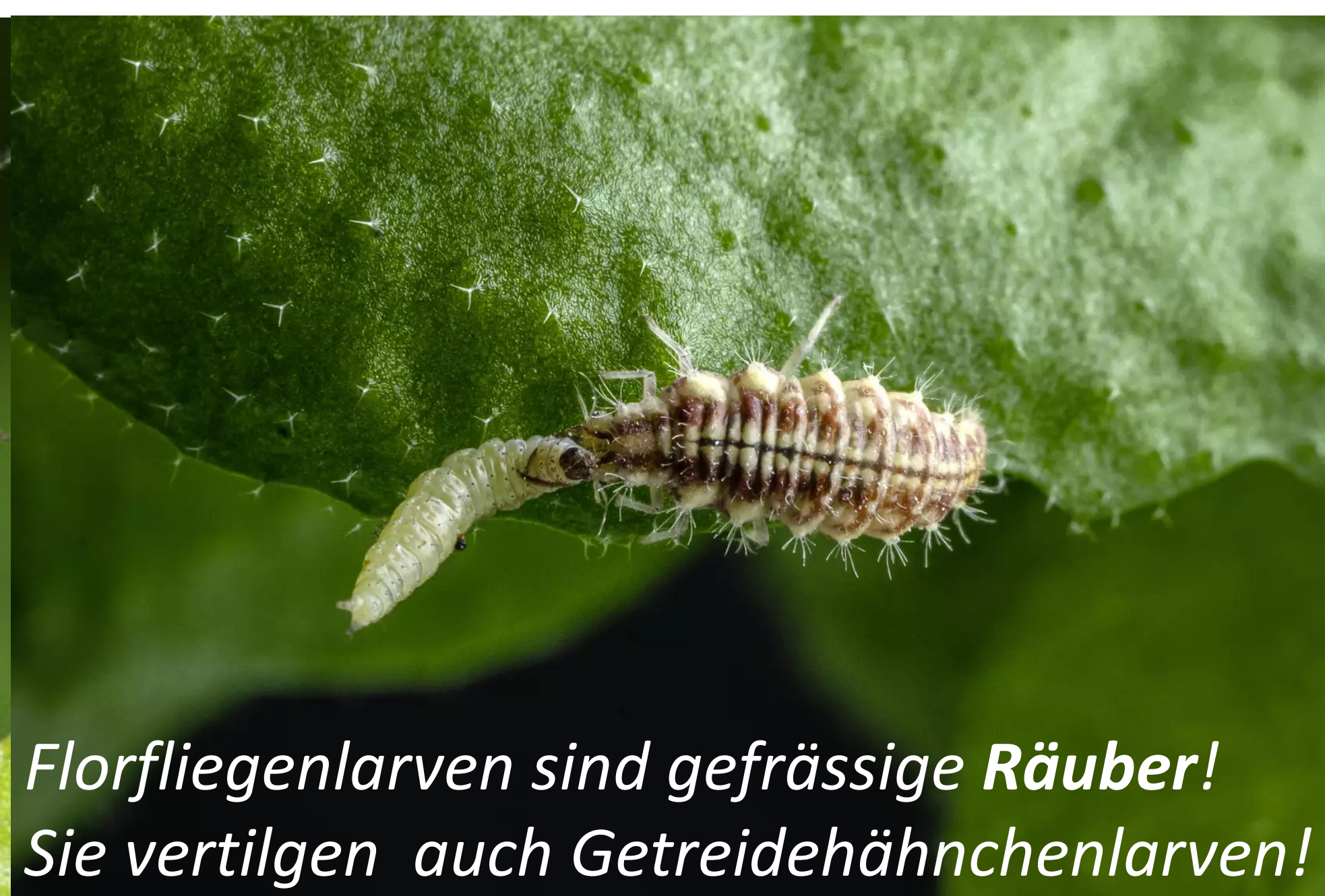
Florfliegenlarven sind gefräßige Räuber! Sie vertilgen auch Getreidehähnchenlarven!