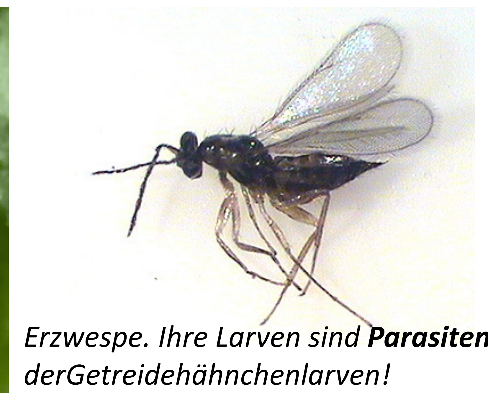
Erzwespe. Ihre Larven sind Parasiten der Getreidehähnchenlarven!